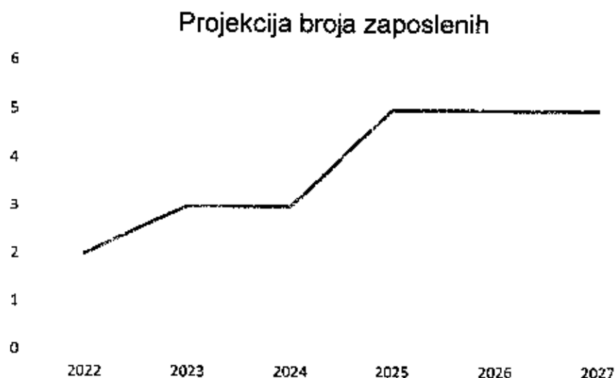
Grafički prikaz: Plan kretanja broja zaposlenih po godinama

Planirano kretanje broja zaposlenih prikazano je grafičkim prikazom u nastavku, a odnosi se na period od 2022. g. - 2027. g. Grafički prikaz prikazuje povećanje broja zaposlenih u odnosu na prethodne godine (prosječan broj zaposlenih).